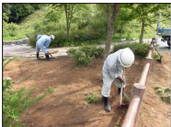
除染作業状況(公園施設)