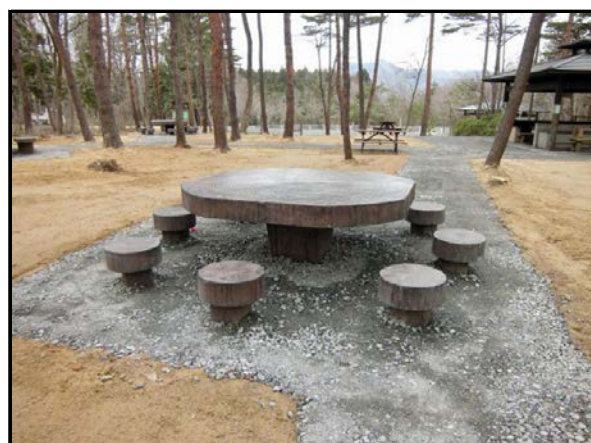
除染完了後状況(公園施設)