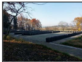
久来石地区仮置場（搬入前）