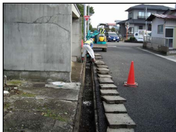
仁井田地区内側溝除染作業