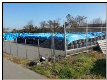
仁井田地区仮置場（搬入中）