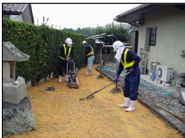
仁井田地区内住宅除染作業