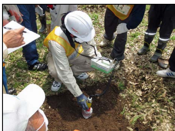
コリメータ使用し線量確認