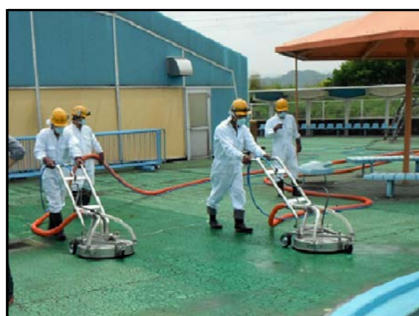
同時吸引型高圧洗浄実施