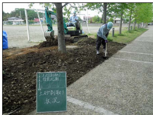
社川小学校除染状況