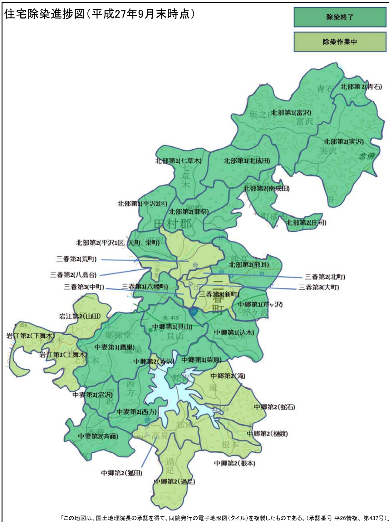
住宅除染進捗図(平成27年9月末時点)