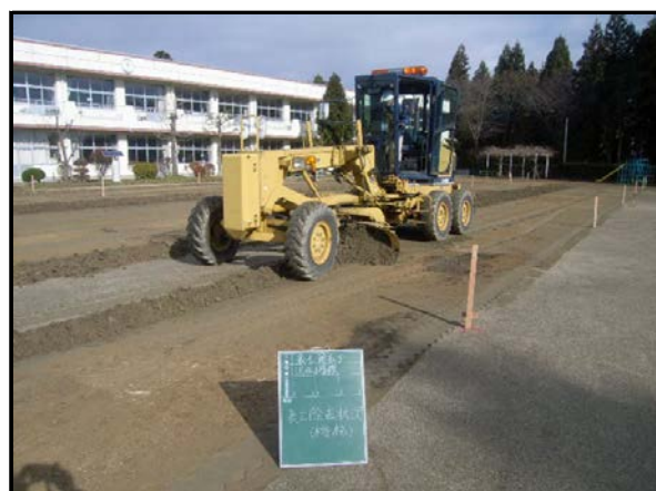
沢田小学校校庭除染