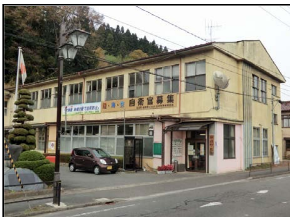
石川町役場(本庁舎)