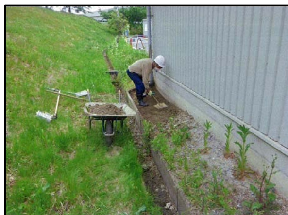
除染(表土剥ぎ取り)