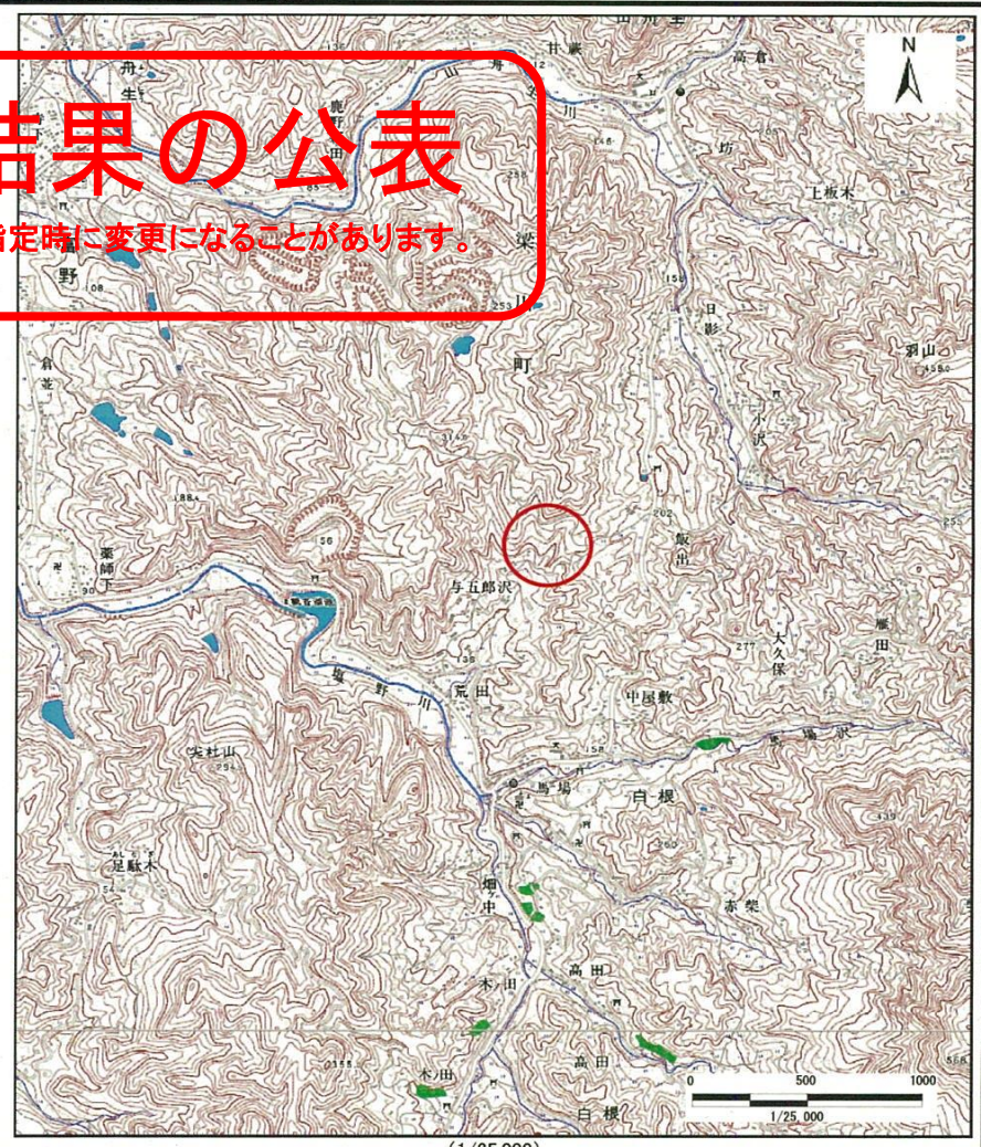
様式-1 (土) 土砂災害警戒区域・土砂災害特別警戒区域 位置図