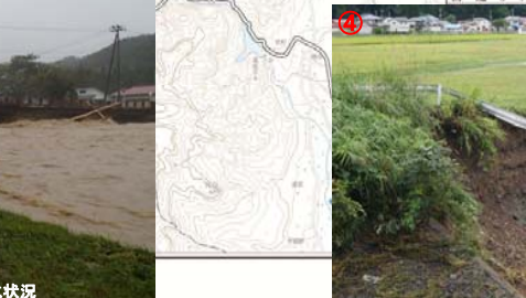
桧沢川(金井沢地内)被災状況