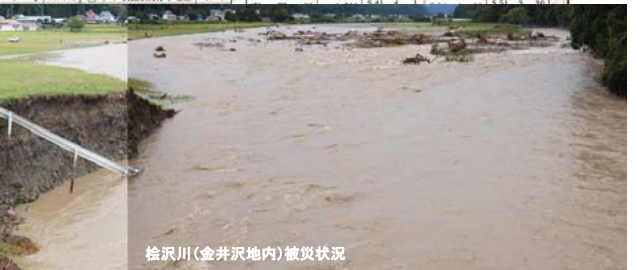
桧沢川(金井沢地内)被災状況