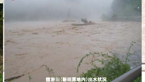
館岩川(新田原地内)出水状況