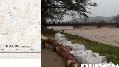
阿賀川(川島地内)出水状況