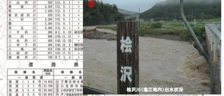
桧沢川(塩江地内)出水状況