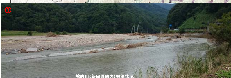
館岩川(新田原地内)被災状況