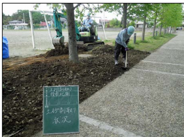
社川小学校除染状況