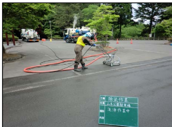
山本公園駐車場除染状況