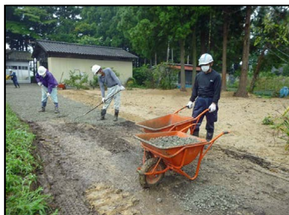
住宅除染実施状況