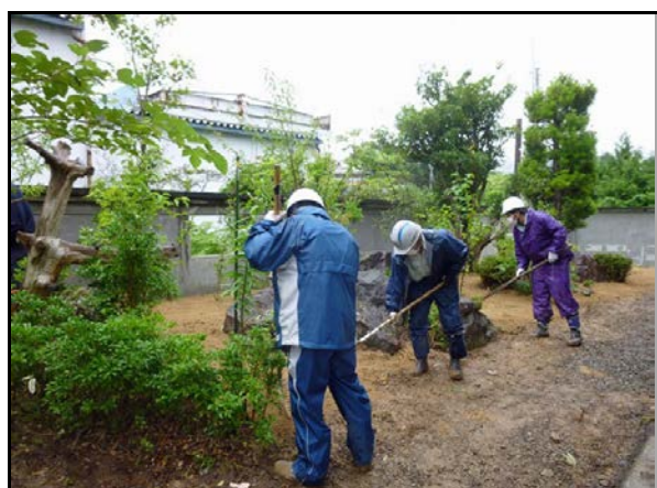
住宅除染実施状況