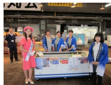
「おいしい ふくしま いただきます！」キャンペーン