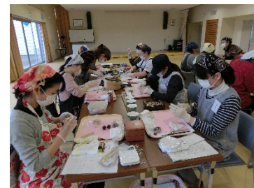
サポート事業(そうま菓子の四季)