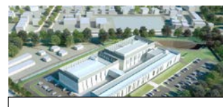
ふくしま医療機器開発支援センター(H28年度開所)