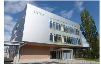
会津大学先端ICTラボ