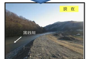
黒谷川の様子(只見町)