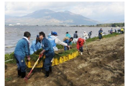
漂着水草回収活動

*ヨシ刈り及びごみ撤去作業 7~9月にボランティア229名でコンテナ1902箱のヒシ、8月に刈り取り船で2,400kgのヒシを除去