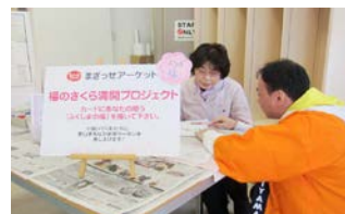
まごっせアーケード