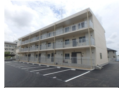
完成した復興公営住宅 (八幡小路団地)