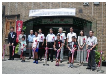
只見線ミュージアム列車出発式

*会津若松市内 134 戸の整備計画のうち H26 までに 28 戸が完成・入居しています。