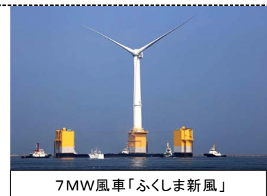
7MW風車「ふくしま新風」