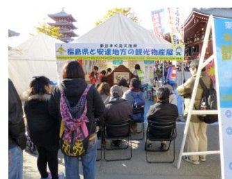
浅草寺での情報発信