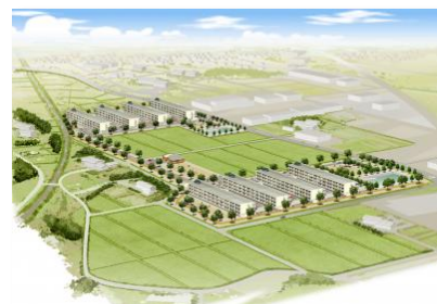
復興公営住宅(イメージ)