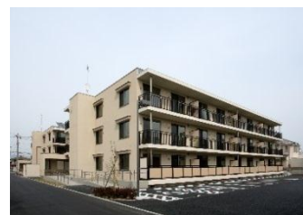
復興公営住宅の整備 (笹谷団地)