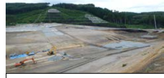
藤沼湖の復旧工事