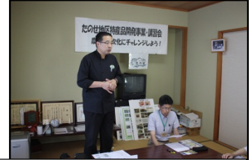
特産品開発講習会(南会津町たのせ区)