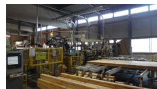
プレカット加工施設