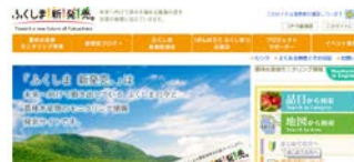
農林水産物モニタリング検索サイト 「ふくしま新発売」