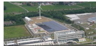
福島再生可能エネルギー研究所(平成26年4月開所)