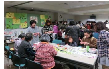
交流サロンフェスタ