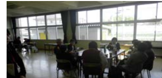
健康支援サロン 「こらんしょひろば」