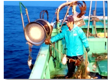
相馬港の試験操業風景