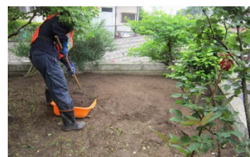
住宅除染の様子(イメージ)