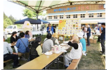
おいしいふくしまいただきますキャンペーン