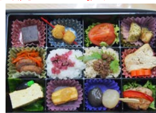
おもてなし女子駅弁

(H26実績)・花情報共有サイト「ふくしまハナミゴロ」構築 ・「おもてなし女子駅弁」の試作販売 等