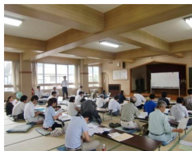
地域産業6次化いろはゼミ講義風景

◆只見川圏河川整備計画協議会を開催し (H26 年 3 回)、河川整備計画を策定しました。〔国の認可取得:H27 年 3 月 20 日〕