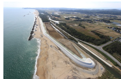
夏井地区海岸堤防