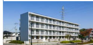
昨年完成した復興公営住宅