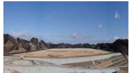
工業の森・新白河B工区

さらに、メガソーラー（2MW/h以上）が6カ所（計18.2MW/h）で稼働しており、3カ所（計33MW/h）で稼働に向けて工事が進められています。