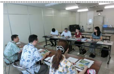
海外からの視察の受入

(これまでの実績(H27.8 現在): 全延長8.3kmのうち、2.3kmの区間で計画合意及び0.6km区間で用地取得契約の調印完了)