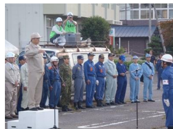
県北地方防災訓練