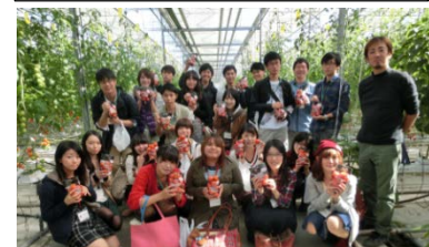
いわきの今を見に行く! モニターバスツアー