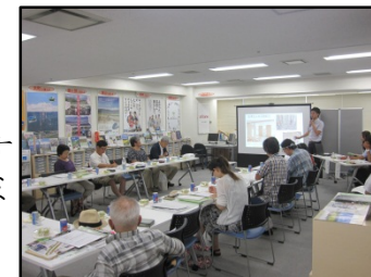
田舎暮らし応援セミナー(東京)