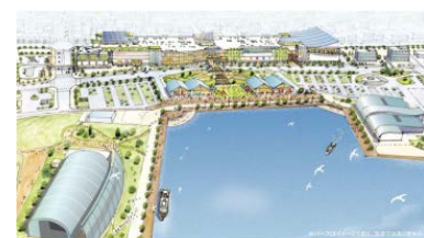
小名浜港背後地整備イメージ