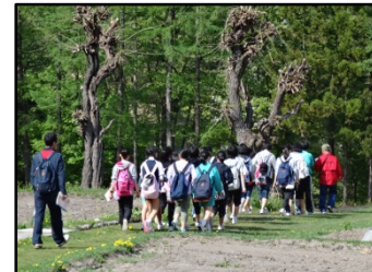
「おいでよ!南会津。」学びの首都づくり事業