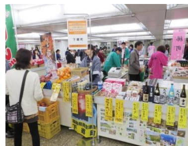
首都圏イベント事業ふくしま東京キャンペーン

*湯川南 IC~会津若松北 IC 間 (L=3.0km) が 9 月 6 日に開通