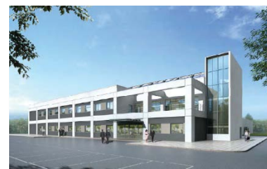
環境放射線センター(イメージ)