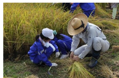
児童による稲刈り体験

また、企業との共同により高等学校の実習機材更新を実施するとともに、高度な人材を育成するための環境整備、学生と企業のネットワークづくりを行っています。