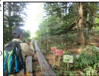
防鹿柵の巡視(尾瀬)