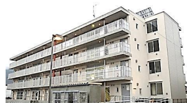
完成した復興公営住宅(古川町)