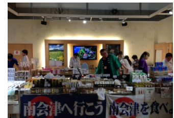
「おいでよ!南会津。」観光物産フェア(東京都庁)