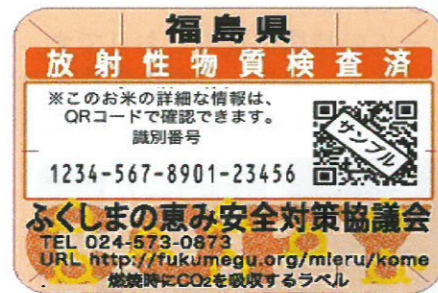
（見本2） 平成27年産米の検査済みラベル