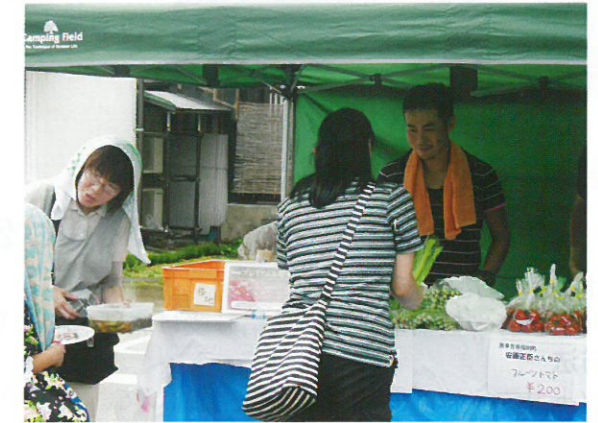
麺つゆ漬けはいかがですか