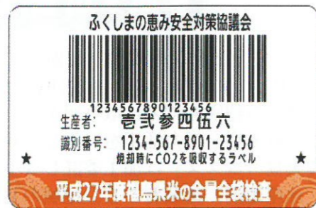
（見本1） 平成27年産米のバーコードラベル