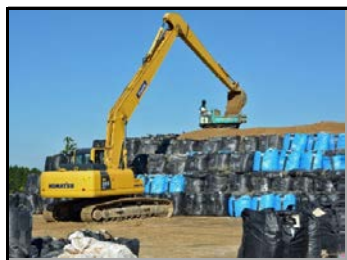
仮置場での遮へい作業