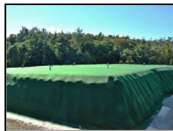
完成された仮置場