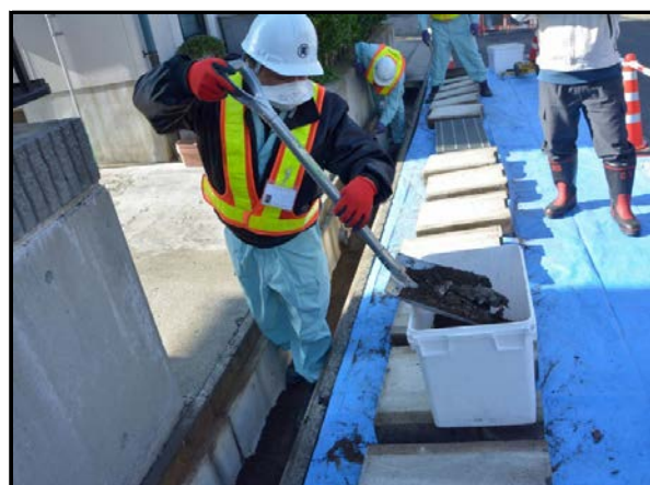
道路除染での側溝堆積物の除去作業