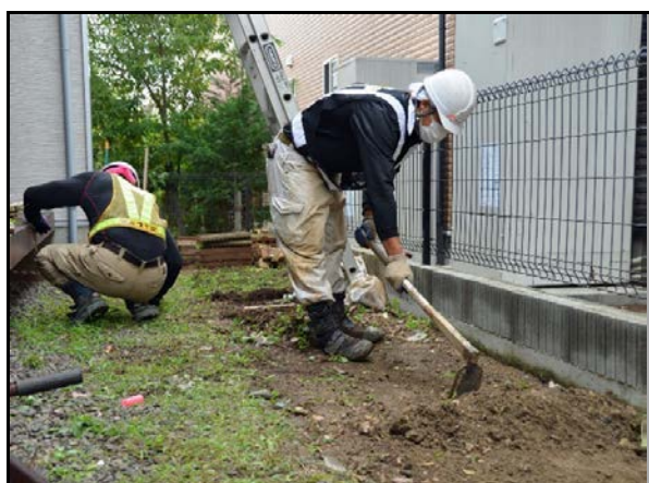
住宅除染での表土の剥ぎ取り作業