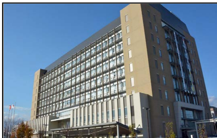
福島市役所本庁舎