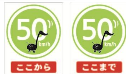
案内看板デザイン