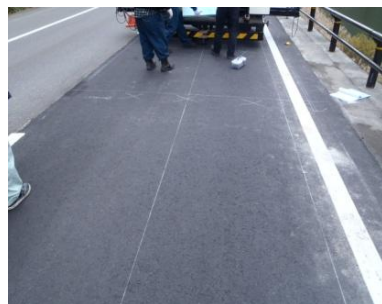
切削箇所に印を付ける