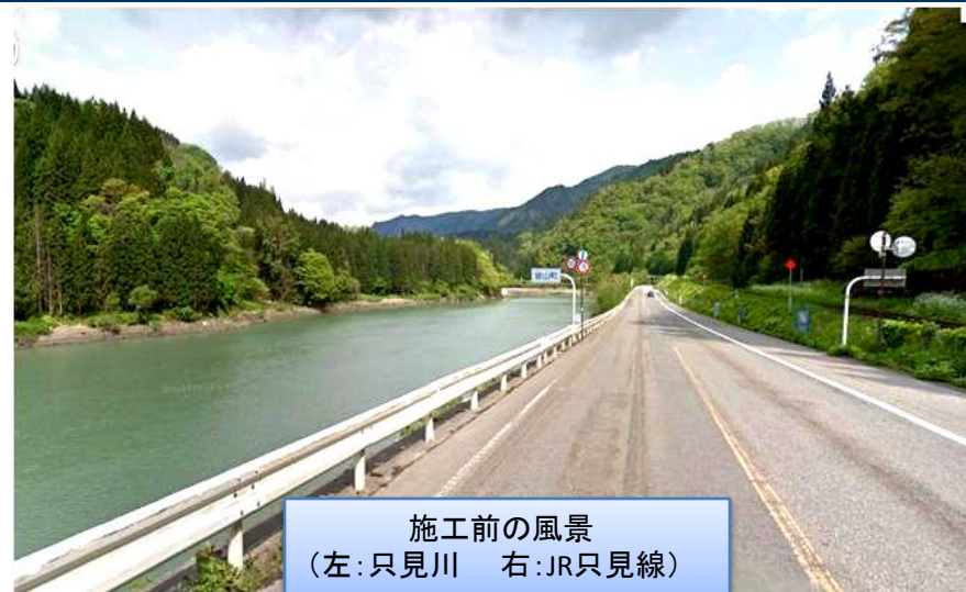
施工前の風景 (左：只見川 右：JR只見線)