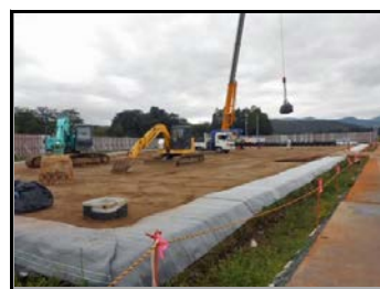
仮置場造成・搬入状況