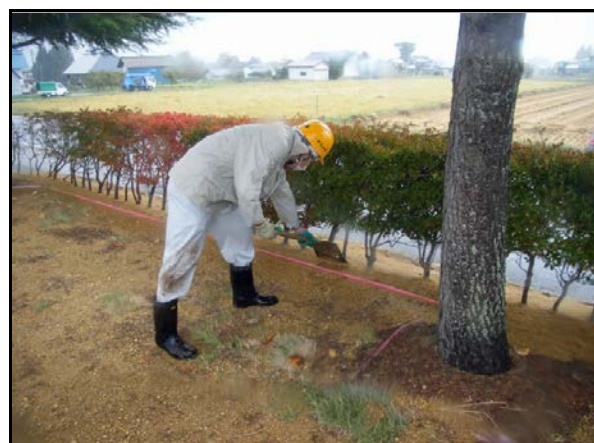
役場周辺除染(客土)