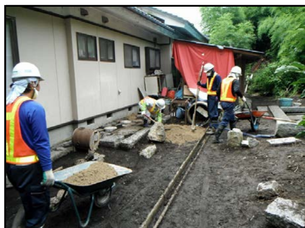
住宅除染実施状況