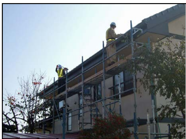
住宅除染実施状況