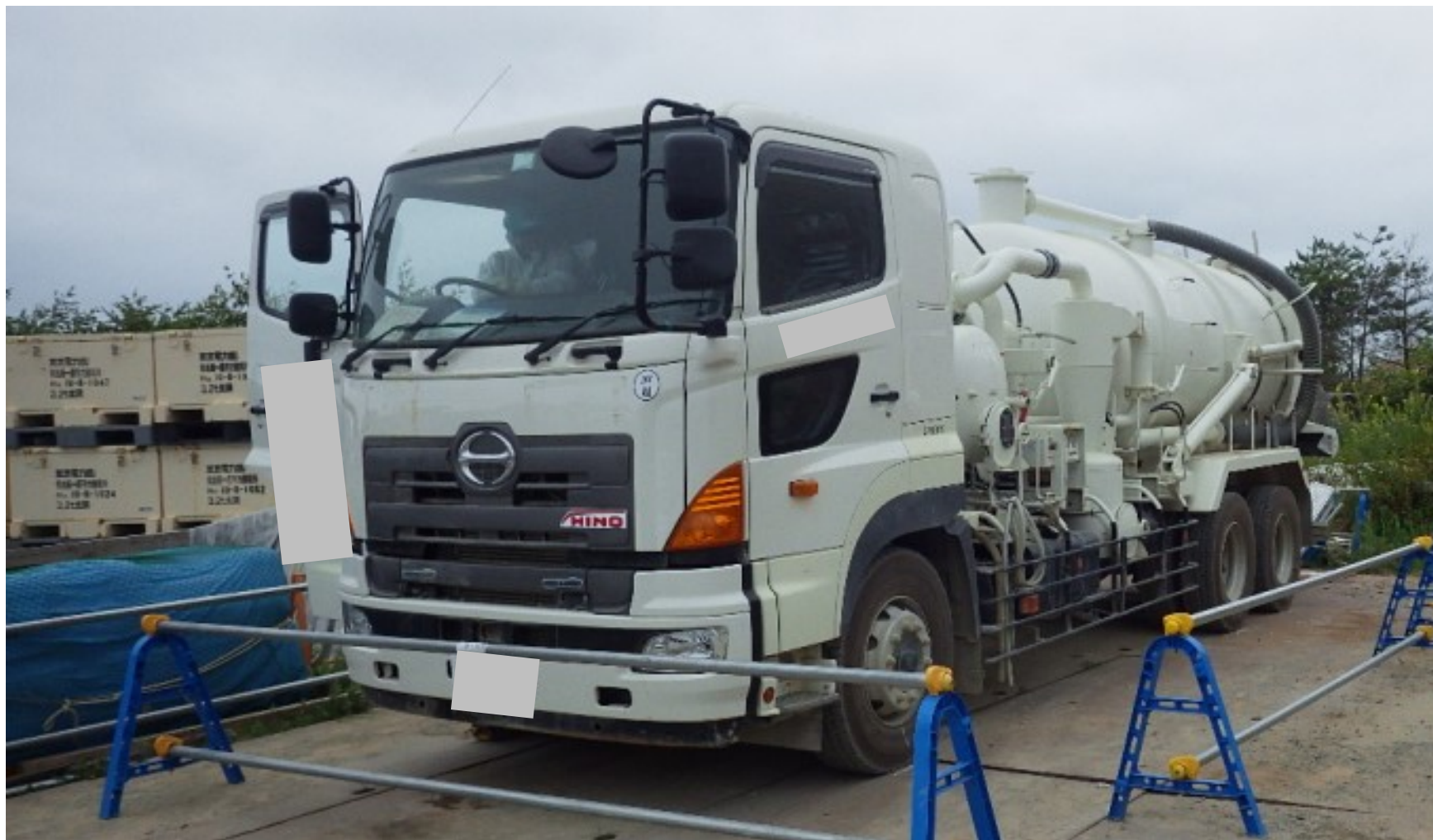
使用車両 (バキューム車 / タンク容量10m 3 )