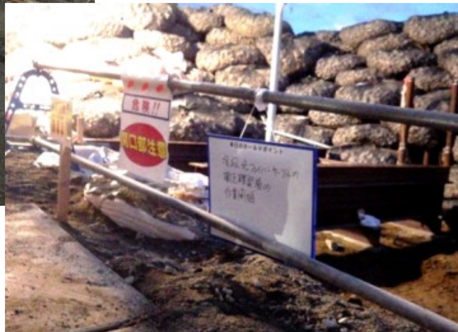
現地KYボードの掲示状況