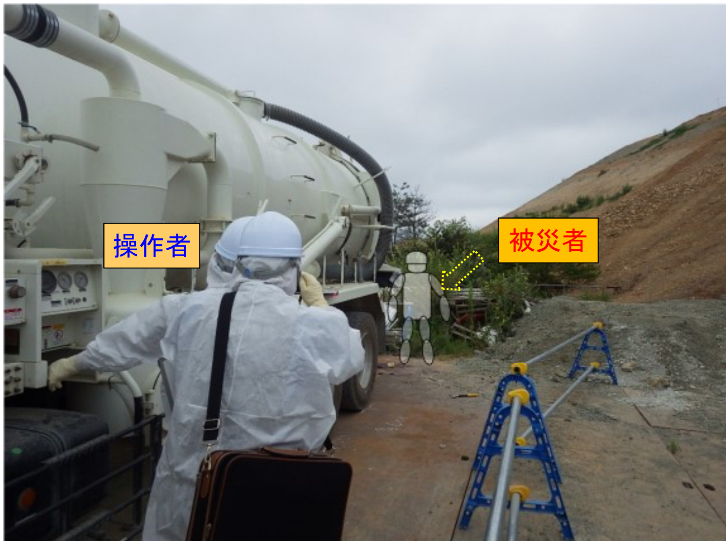
タンク蓋“閉”操作開始時の 操作者と被災者の位置関係 (推定)