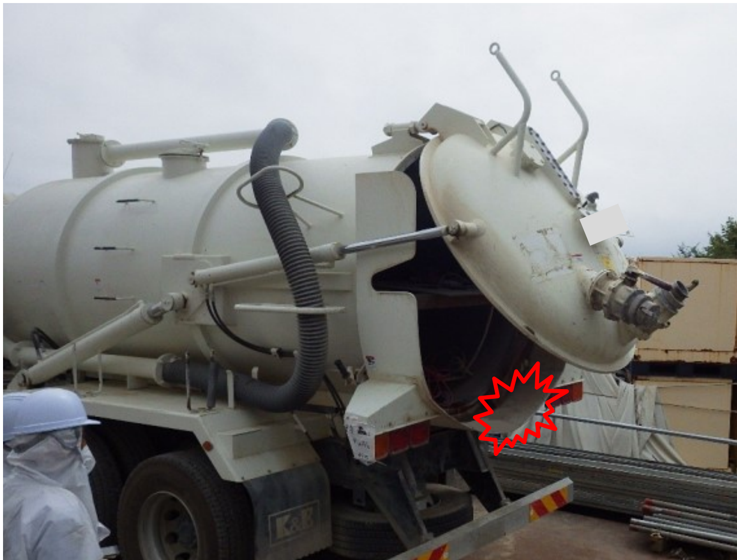
後部タンク蓋開閉動作の確認状況