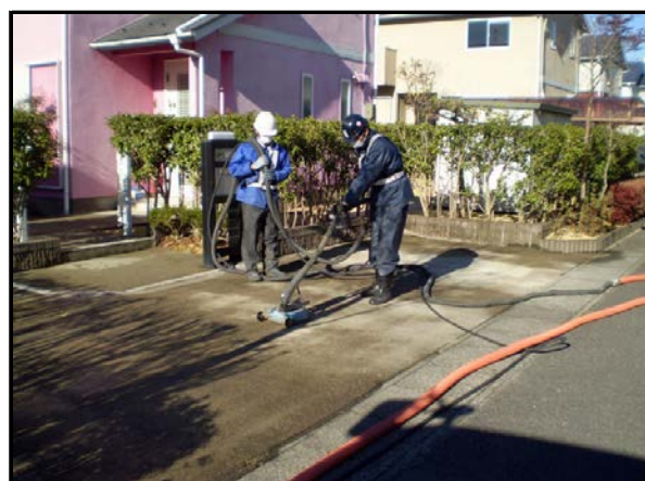
コンクリート洗浄作業