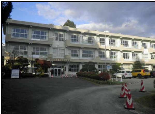
除染現場 (里白石小学校)