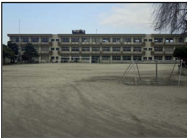
除染現場 (浅川小学校)