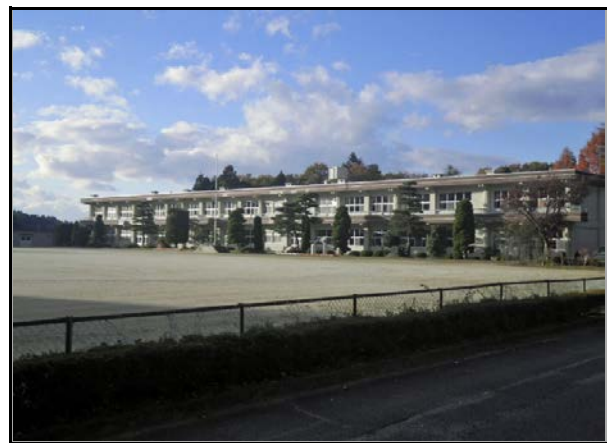
除染現場 (山白石小学校)