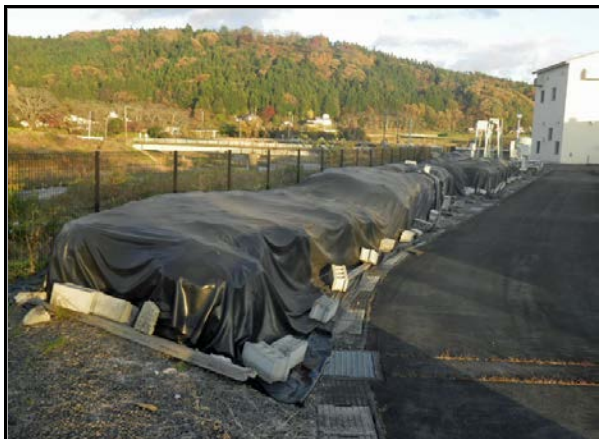
現場保管 (浅川浄化センター)