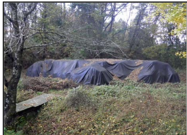
現場保管 (山白石小学校)