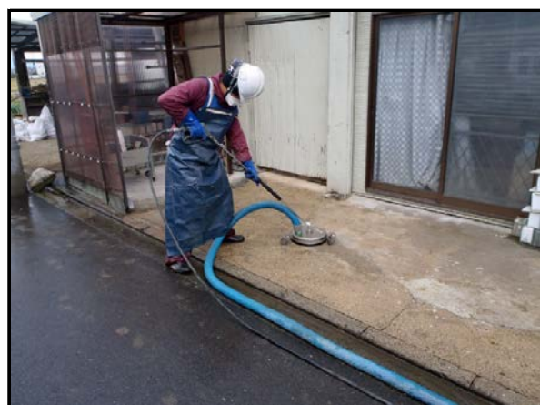
吸引型高圧洗浄によるコンクリートたたき等の除染作業