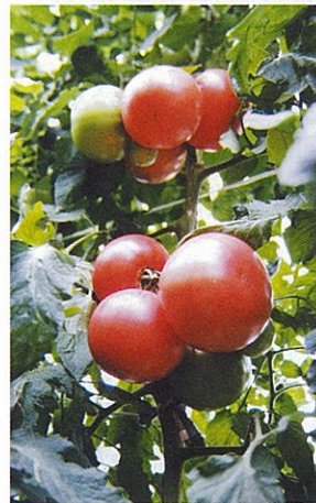
美味しい農産物を作ってくださいね♪

その他、Uターンで親と一緒に経営、副業的な農業参入、定年帰農等の相談があり、各支援策、新規作物導入のアドバイス、農業短期大学校就農研修への誘導を行いました。