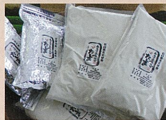
事業を活用して売り出したソバ粉

生産は、遊休農地(耕作放棄地)も活用し、大規模栽培を实践、福島県新品種「会津のかおり」の種子生産にも取り組んでいます。また、販売においては、直売所や直営そば屋も運営し、地産地消や高付加価値型農業の確立に向け、積極的に展開しています。