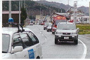
広域消防伊南出張所を 出発するパレード

空気が乾燥し、山菜採りなどで山に入る人が多くなることから、山火事予防を啓発するため、4月18日(土)25日(土)に南会津地区山火事防止対策協議会主催による山火事予防パレードが開催されました。