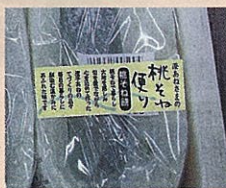
アドバイスを受け、ラベルデザインをして販売

たじゅうねん(エゴマ)味噌、漬物、餅等 出荷先:直売所、物産館、ゆうパックでの通販等