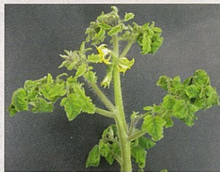
トマト黄化葉巻病の症状

タバココナジラミが伝搬するウイルス病で、この病気にかかると薬剤では対処できず、著しく減収します。このため、当地域に発生すると甚大な被害が予想されます。