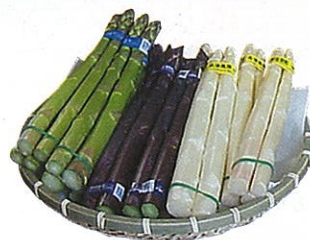
三色アスパラガスを 召し上がれ♪