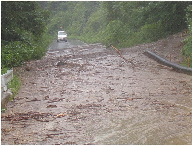
豪雨により荒廃溪流から土砂が流出