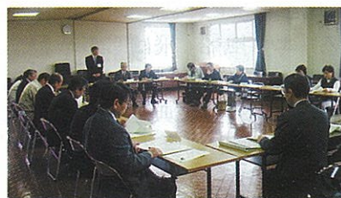
活発な意見が交わされました

現在、経済・雇用情勢が厳しさを増しておりますが、農林業にとってはこの逆風をチャンスととらえ、新規就業者の獲得等の積極的な展開を図っていく必要が