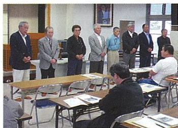
設立を祝う協議会のメンバー

南会津地域のそば生産農家やそば屋等が一堂に会し、「南会津地方そば振興協議会」の設立総会が去る5月8日、南会津町の田島建設会館で開催されました。これは南会津地域のそばの生産技術の向上、生産振興、団地化の推進、販路の拡大、そば祭り等各種イベントの開催等を目的としたものです。