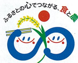
ふくしま食と農の絆づくり運動

読者の皆さん、「ふくしま食と農の絆づくり運動」をご存じですか?そうそう、右にあるとおり、毎月この「南会津のうりんニュース」の巻末に出てくる稲穂と箸を持つロゴマーク、それと昨年12月号で特集した、あの運動です!