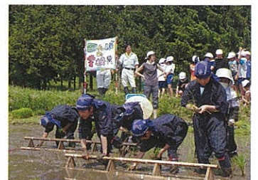
野良着で田植えをする5年生

また、5月27日には、全校児童が参加して田植えを行いました。田んぼに入った子どもからは「ぬるぬるして気持ち悪い!」「すごく気持ちいい♡」など歓声が響きました。最初は、恐る恐る足を動かしていた子どもも、慣れてくると泥を跳ね飛ばしながら、『ころがし』という苗をまっすぐに植え付けできる木製三角杵を使い、「せーのっ!」のかけ声で元気よく田植えを行いました。ローテーショ