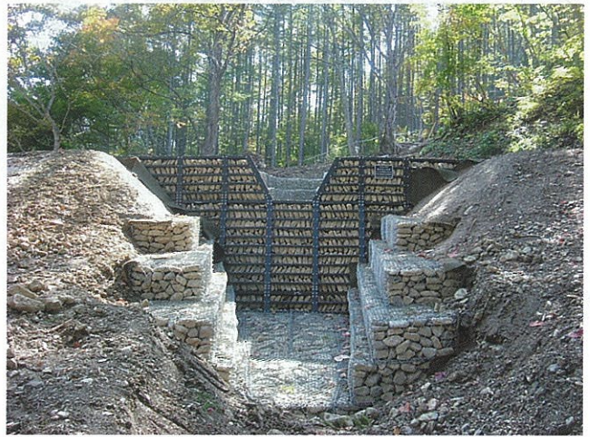
治山事業による復旧状況