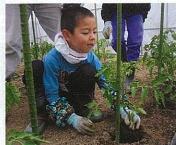
トマトの定植をする参加者

南会津教育事務所 主催の「キッズ野 菜ソムリエ養成講座」 に南会津郡内の幼児・ 小学生17名が参加し、 只見町において6月に 開講しました。