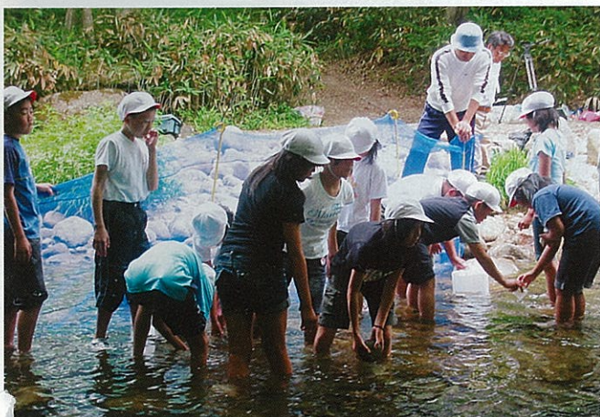
水棲生物の観察をする小学生