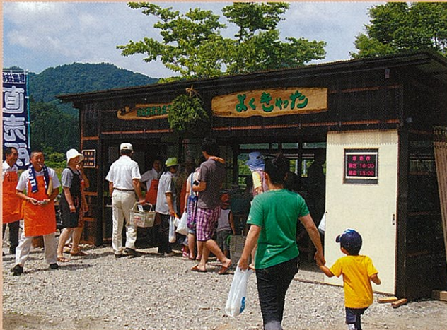
買い物を楽しむ方々

直売部門では、昨年从小立岩営農改善組合(南会津町伊南地域)で「よってけやれ直売所」を運営しています。尾瀬への玄関口である国道352号沿線の集落の真ん中という絶好の立地条件と、今年新たに購入した名前入りのテントで、昨年以上に組合員のヤル気がみなぎっています。今年は8月3日(日)～11月2日(日)の毎週日曜日9時～15時まで営業します。