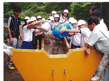
土石流の実験をする子どもたち

主催者からの挨拶の後は土石流の実験。土砂をいっぱい入れた水路の模型にバケツで水を流し込むと、ものすごい勢いで土砂が流れます。水の力と土石流の恐ろしさを感じました。次いで、治山ダムの模型を取り付け、再度、水を流し込むと今度はダムで土砂が止ま(2ページに続く)