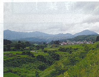
甲子道路から見渡す風景

トンネルの現場を見学する機会があり、坑内に入ることができた。ほぼ完成に近く、接続する道路の工事が急ピッチで進められていた。