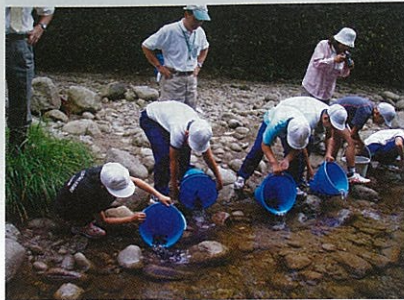
イワナの放流をする児童

(1ページから続く) りました。子どもたちは、治山ダム の効果を目の当たりにして、目的を 理解したようです。