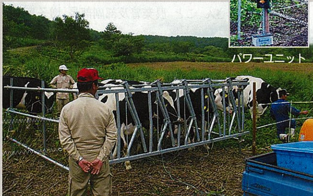
下郷町鶴ヶ池地区における遊休農地への牛の放牧

おり、去る7月26日に東北農政局農村計画部農村振興課の担当者が南会津町を訪れ、町の「遊休農地解消計画」の策定状況と推進