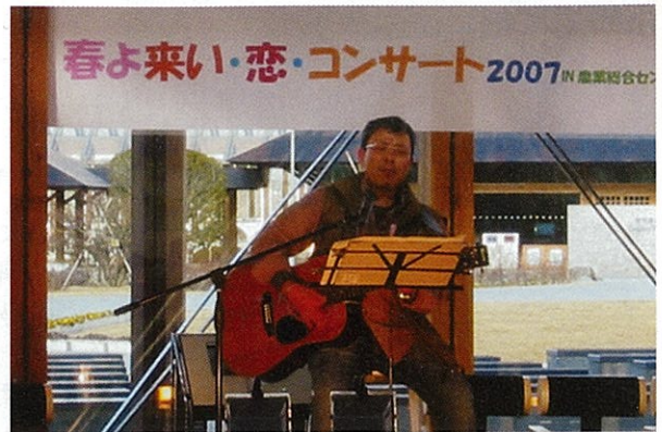
県農業総合センター(郡山市)にて

僕の歌は「農唄(農業・農村にまつわる歌)」と勝手に定義付けし、フォークソング系の曲を付けてギターを弾き語りをしている。年に2~3曲くらいは新曲を作るが、消費者への地域農産物のPRソングや農業者などを励ますメッセージソングである。オリジナルは30数曲で、最近では、7月に作った曲で『アスパラ王子さま』という歌