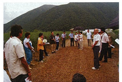
現地研修会の様子

去る7月10日から11日にかけて、南会津町、只見町を舞台に、福島県内の指導農業士、青年農業士が一同に会した平成19年度福島県農業士全員研修会が開催されました。この研修会は、県指導農業士会と県青年農業士会の合同研修会ですが、企画や現地案内などの運営は地元南会津の農業士が行いました。