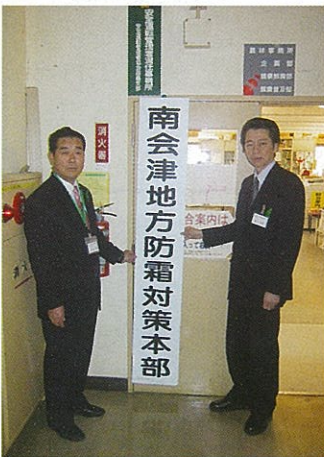
対策本部の設置 (4月17日)

南会津地方では4月中旬から6月上旬まで晩霜による農作物被害の危険があることから、被害の未然防止と技術対策について南会津地方防霜対策本部(地方本部)を設置し対応にあたっております。本年も4月17日に地方本部を南会津農林事務所内に設置し、各町の対策本部も設置されているところ