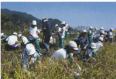
全校生徒で稲刈りしました

去る9月21日南会津町立田島第二小学校(旧田島町)で行っている『田んぼの学校』において、澄み切った青空の下、この春植えたコガネモチの稲刈りが行われました。