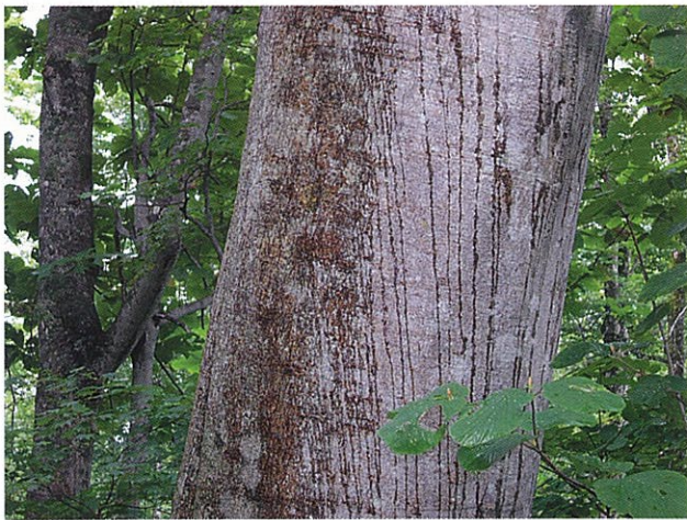
木から滑り降りたツキノワグマの爪痕(三岩岳登山道)

バードウォッチャーという輩は、行動派が多い。憧れのトリに会うためにはたとえ火の中、水の中、どこへでも出かける。くだんの女性もブッポウソウに会うため、長野県栄村まで行って来た。ただし、ツアー参加だという。