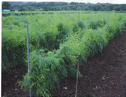
水無地区のアスパラガス栽培

南会津水無・中荒井地区における水無そば組合・FKファーム・南会津アグリサービスによる遊休農地の活用事例(そば・アスパラ)及び、下郷町落合地区における