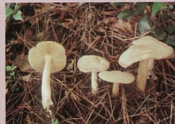
クサウラベニダケ

毒キノコを食べてしまったときは、最悪の場合は死亡してしまいますので、知らないキノコや種類の判定が疑わしいキノコは、採らない、食べないが基本です。