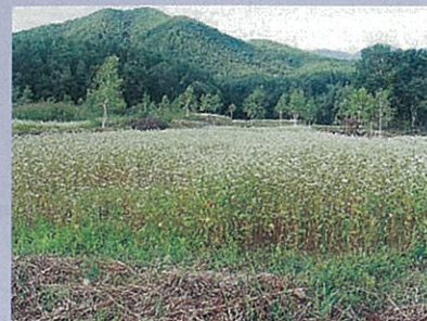
遊休農地を利活用したそば栽培

した。なかでも、田島町水無地区においては水無そば組合により約12haの遊休農地を活用したそばの栽培が行われ、今後も一層の遊休農地解消