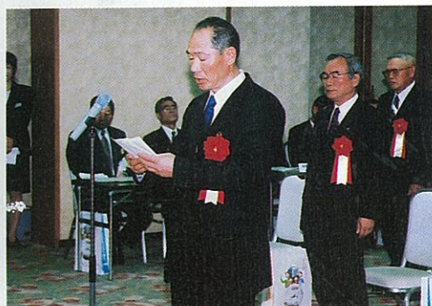
代表謝辞を述べる芳賀区長

表彰式終了後には県庁を訪れ、農林水産部長をはじめ関係各課を訪問し、受賞の挨拶と「豊かなむらづくり全国表彰」県代表としての抱負を報告しました。 (地域農林企画室)