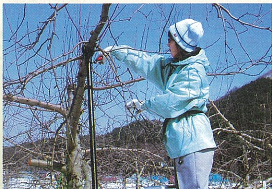
今年も頑張ります

このすばらしい南会津の自然の中で農業に従事する生産者と接する普及員となり、一年が経ちます。この間様々なことを体験してきました。農家体験研修では、農家の方の農業への思い、意欲、夢などを感じることができました。また、収穫時の喜びは格別にもかかわらず、収穫直前に雹害に遭ったことは非常に悔しく、自然災害の厳しさも実感しました。