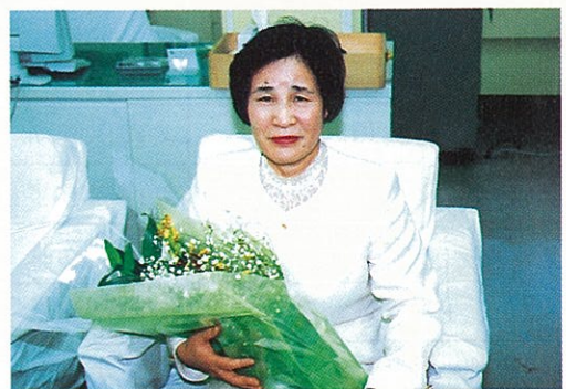
タイトル横の写真 会津駒ヶ岳（檜枝岐村） 5月20日山開き