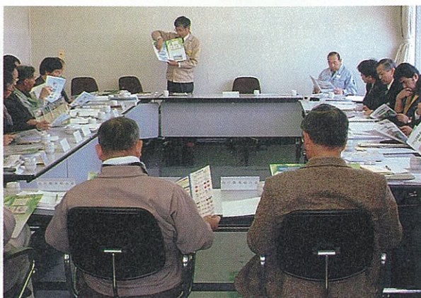
▲各種会議に出席して説明していきます

早速、4月4日に行われた伊南村農事組合長会議に出向いてパンフレットの中身を説明しました。今後も、このパンフレットを使った説明会を各地で開催し、「うつくしま農業・農村振興プラン21南会津地方計画」の浸透を図って行きたいと思えます。（地域農林企画室）