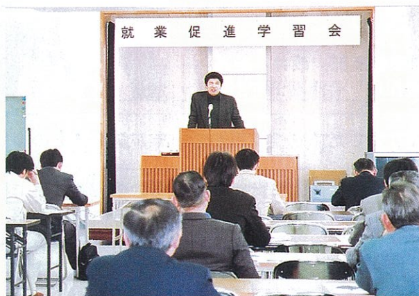
高校生からも意見発表が行われました