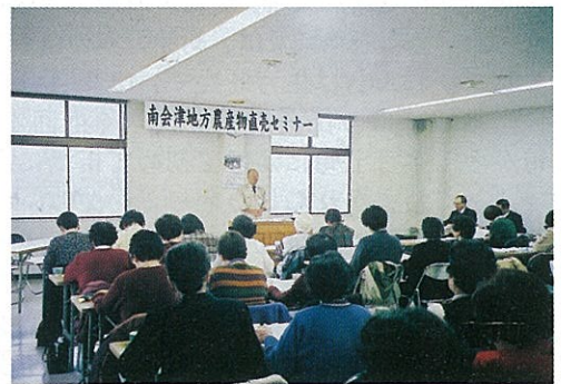
直売は衛生管理が重要!

なお、第二回目は2月19日午後よりJA会津みなみ本店を会場に「直売所で人気の野菜づくりのポイント」を開催します。午前中には南会津地方農業経営者セミナーも開催しますので、是非ご参加ください。(農業普及部)