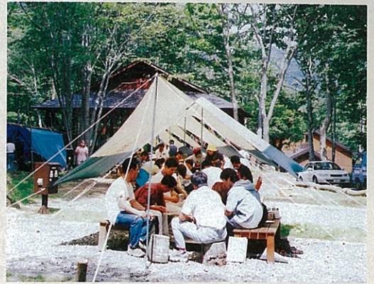
美しい自然の中でのキャンプは最高！

伊南川とその支流に囲まれたこのキャンプ場は、ブナやナラなどが美しい森林内にあることから、自然