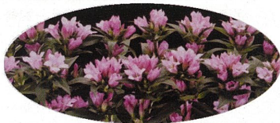
まさに可憐な花姿と色

りんどうは現在、厳しい市場情勢となっていますが、「ふくしまかれん」をはじめオリジナル品種導入が契機となり、産地発展に繋がるのが期待されます。