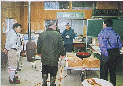
木材の利用を学びました