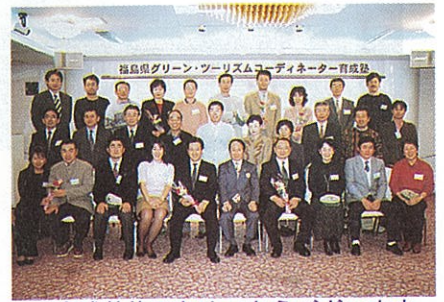
育成塾修了おめでとうございます