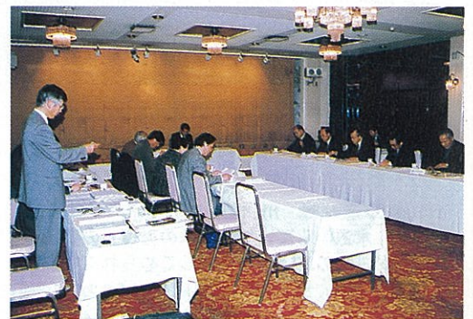
活発な意見が交換されました