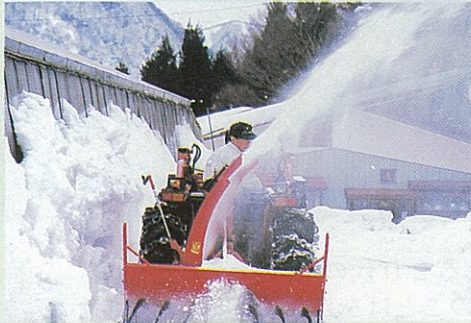
ハウスまわりの除雪作業

ハウスの中は、暖房設備と2重カーテンによって、程良い暖かさに保たれていますが、外ではトラクターにセットされた除雪機が、連日フル稼働で除雪作業に追われています。