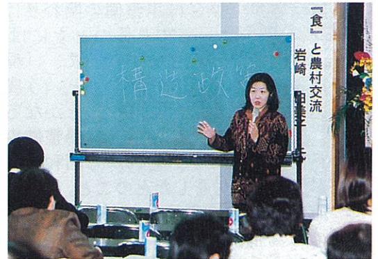
健全な食生活推進大会

両講師の講演をうけたことにより、南会津地方のグリーン・ツーリズム推進に大いに役立つものと期待されます。