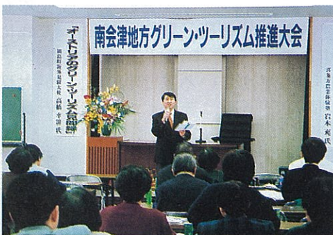
グリーン・ツーリズム推進大会