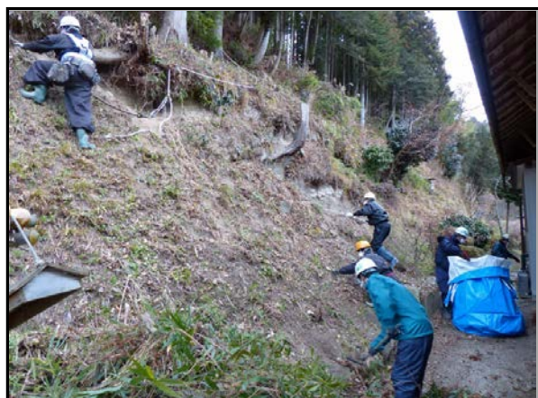
夏井地区除染作業