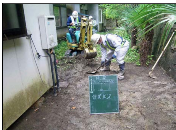
表土剥ぎ取り作業