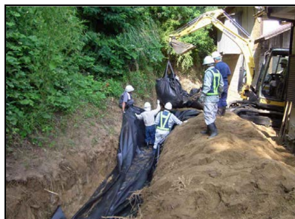
フレコン埋設作業