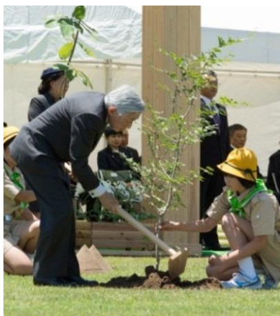
天皇陛下 お手植え (平成26年第65回全国植樹祭)

参加者の植樹樹種は、各会場の特性に沿って選定し、県内外の参加者は、1人複数本を植栽していただきます。なお、詳細については、「基本計画」の中で検討します。