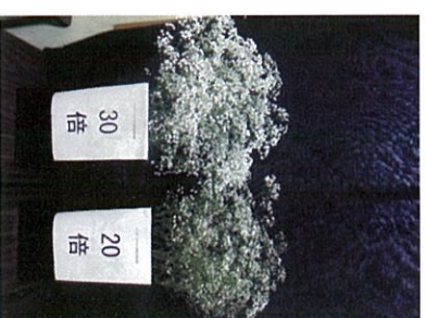
※クリザールかすみ：鮮度保持剤