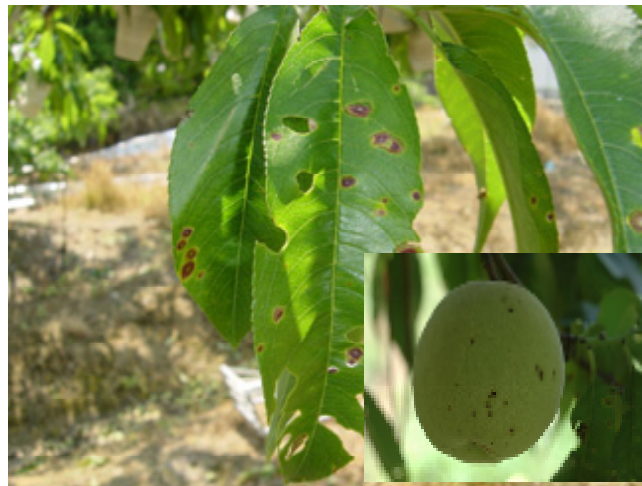
図2 春型枝病斑（スプリングキャンカー）