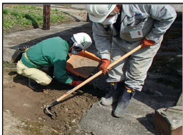
土壌剥ぎ取り作業