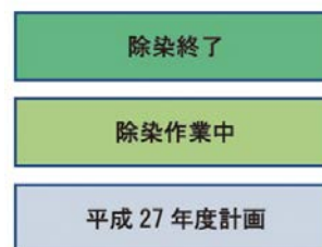
住宅除染進捗図(平成27年3月末時点)