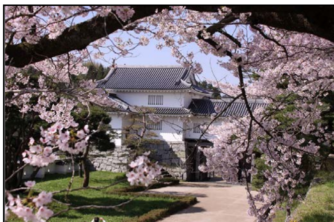
霞ヶ城公園 箕輪門