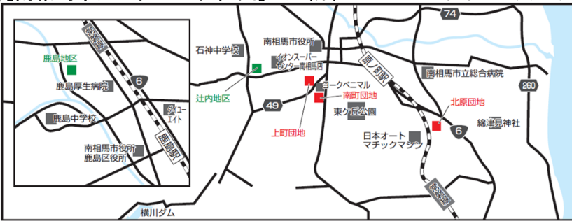
相双建設事務所が整備する復興公営住宅