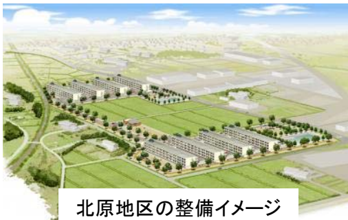
北原地区の整備イメージ