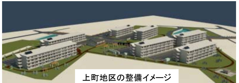
上町地区の整備イメージ