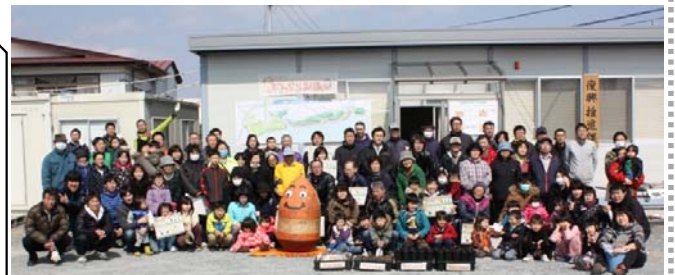
苗作りにご協力いただいた皆様(どんぐり育て隊)

また、地域の皆さまと一緒にどんぐりプロジェクトやワークショップ、その他のイベントにも取り組み、早期の供用開始に向けて頑張っています。