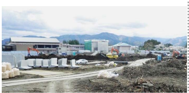
上町地区(南相馬市原町区)の造成工事の様子