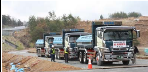
土取場から土砂を運搬している様子