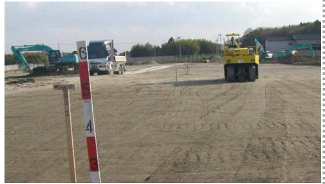
北原地区(南相馬市原町区)の造成工事の様子