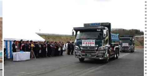
ダンプトラック出発式の様子