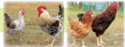
〈川俣地鶏〉 〈川俣シャモ〉

美しく豊かな自然の中で、生産者の愛情をいっぱいを受けて育った福島牛は、鮮やかな色合いと良質の霜降りをもつ絶品の牛肉です。柔らかな肉質、風味豊かでまろやかな美味しさをぜひ一度ご堪能ください。