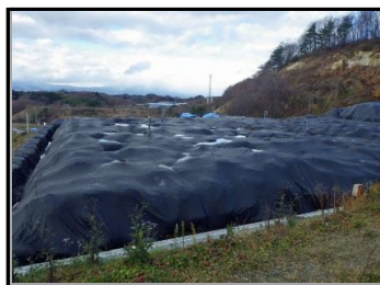
除去土壌等を遮水シートで覆って保管