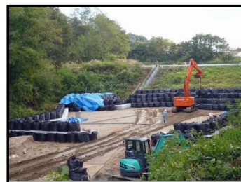
周辺を遮へい土のうで覆い、除去土壌等を据付