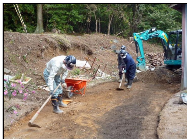
住宅周りの表土除去