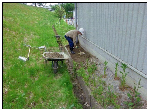
除染(表土剥ぎ取り)