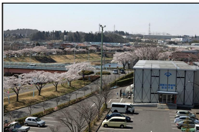
須賀川市役所仮設庁舎