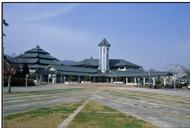
国見町役場仮庁舎(国見町観月台文化センター)