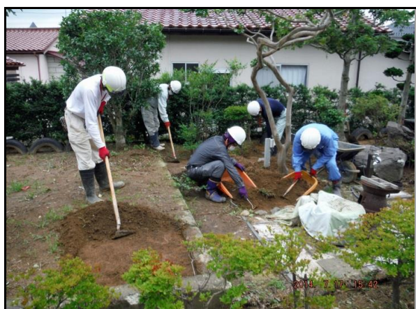
除染作業(表土除去作業)