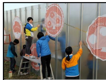
仮置場外壁にデザイン画で装飾