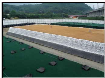
土のうで遮へいし、 遮水シートで覆う前の状況