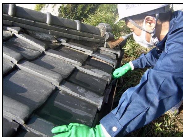
屋根拭き取り状況