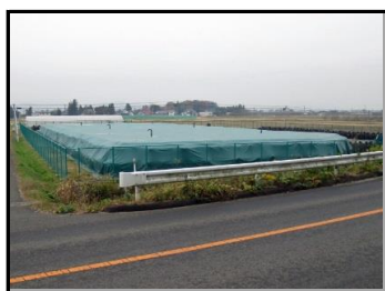
根岸熊ノ前仮置場