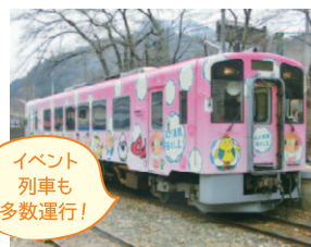
上:会津鉄道のラッピング列車 「花咲く会津号」